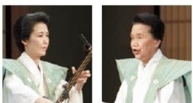
人間国宝 鶴澤津賀寿 人間国宝 竹本駒之助